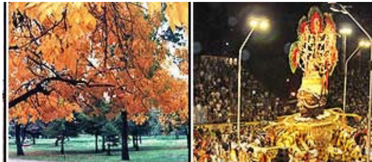
Parques y Carnaval

También se suma al desarrollo en este rubro la presencia de aguas termales que ha generado otro movimiento en derredor de los lugares de explotación. Miles de turistas visitan año a año los complejos hoteleros contruídos junto a las vertientes termales.