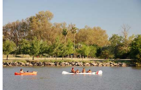
Recreación y deporte en el río