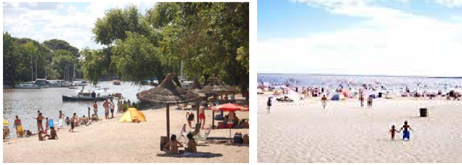
Balnearios en la ciudad y sobre el río