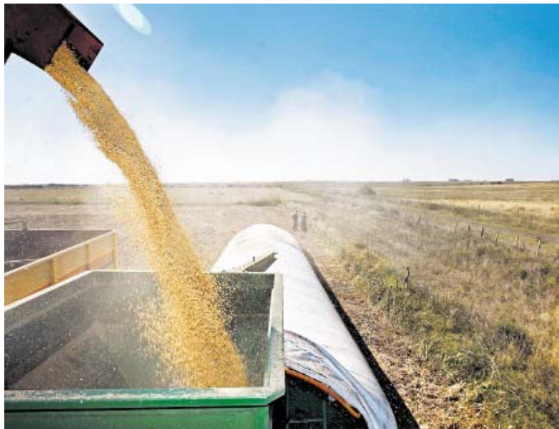
Cosecha de Soja

La cuenca constituye una de las zonas más fértiles de la República Argentina, la agricultura y la ganadería conforman su estructura productiva. El 90% de la superficie está ocupada por suelos agrícolas en los que se producen entre el 6 y 10% de la producción nacional de trigo, maíz, soja y girasol. Los rendimientos de la tierra son de los más importantes del país lo que confiere a la cuenca su gran riqueza.