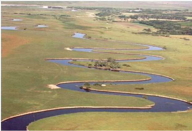
Vista aérea del río Arrecifes

Esta cuenca está ubicada al este de la ecorregión de pastizales de la pampa húmeda, por lo que se caracteriza por el predominio de pastizales de altura media (pradera) y alta.