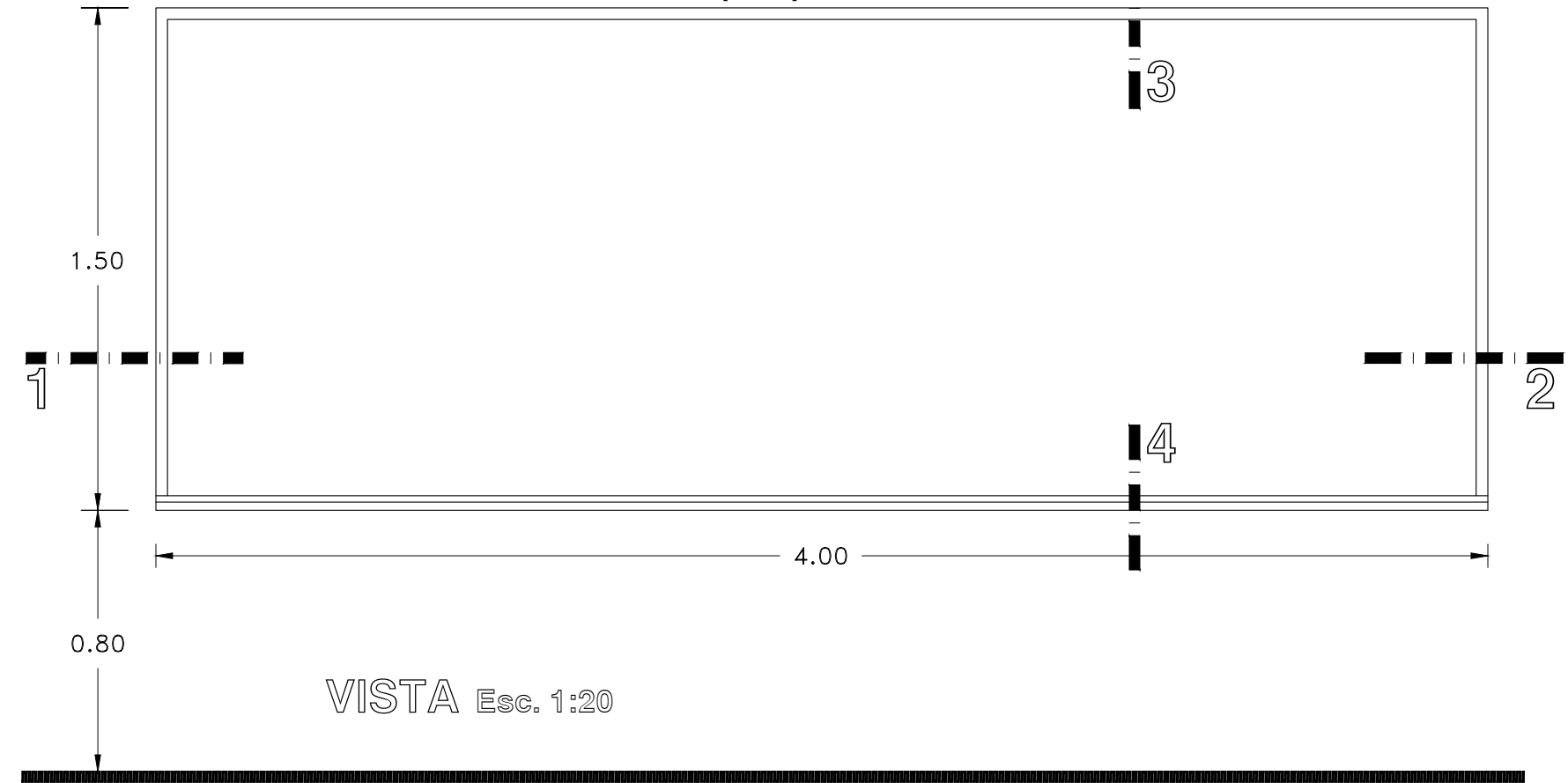
VISTA Esc. 1:20