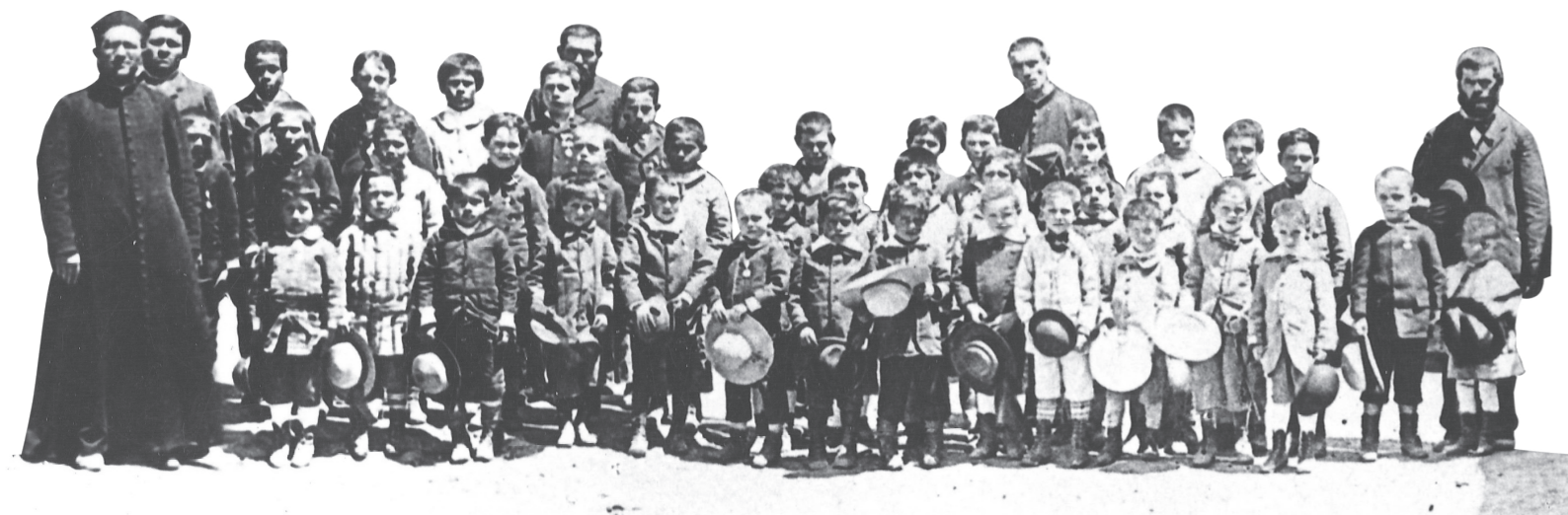
Interior del Colegio de Padres Salesianos en Carmen de Patagones, maestros y alumnos, 1878. Archivo General de la Nación. Documentos Fotográficos. Inventario 311006.