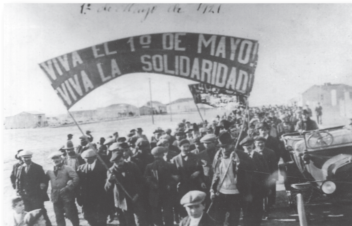
1º de Mayo de 1921 en el Puerto de Santa Cruz, los peones rurales marchan reclamando por sus derechos, pese a la oposición de los patrones de estancias. La represión oficial costó la vida de miles de trabajadores, en lo que luego sería conocida como la patagonia rebelde . Archivo General de la Nación. Documentos Fotográficos, donación Marcos Luis Marinkovic. Inventario 349080.