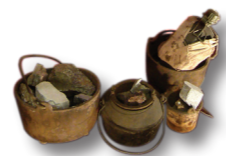
Elementos de minería, Museo Participativo Minero.