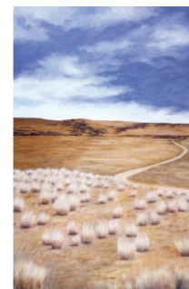
Poblado , óleo sobre tela, 30 cm. x 48 cm.