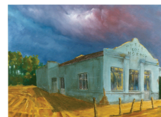
Hotel Los Hornos , óleo sobre tela 50 cm. x 70 cm.