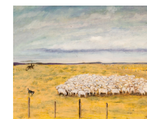
Patagonia V , óleo sobre tela, 80 cm. x 64 cm.